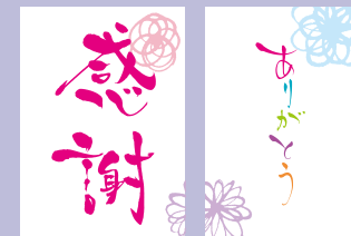
オリジナルグッズ（クリアファイル）