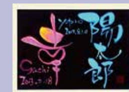
命名書・ウェルカムボード制作 オリジナルグッズ（ポストカード）