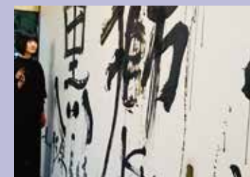
壁画ライブアート（株式会社黒獅子ブランド）

ロゴマーク 名刺 ポスター・チラシ 商品パッケージ 看板・店舗装飾 オリジナルグッズなど